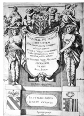
Ulysses Aldrovandi (1522-1605)