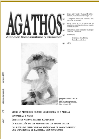
La vendimia o el otoño, 1786-1787. Madrid. Museo del Prado [catálogo 37] Exposición Goya 250 aniversario. Museo del Prado 1996